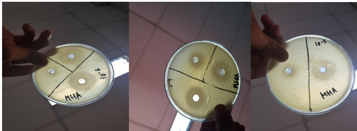
Gambar 3. Zona hambat yang di hasilkan oleh Actinomycetes

Penelitian sebelumnya didapatkan hasil bahwa isolat Actinomycetes yang berasal dari rizosfer padi dapat menghambat Salmonella typhi dan Staphylococcus aureus dengan ditemukan 8 isolat. 17 Hasil pengamatan bahwa isolat Actinomycetes dapat menghambat pertumbuhan Echerichia coli dan Staphylococcus aureus dengan diameter zona hambat sebesar 11 dan 13 mm. Penelitian ini menunjukkan bahwa isolat Actinomycetes yang diambil dari tanah sawah berpotensi menghambat bakteri gram positif dan gram negatif. 18