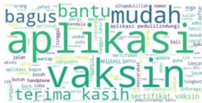
Gambar 4: Wordcloud Sentimen Positif

Pada Gambar 4 diatas hasil dari wordcloud pada data ulasan aplikasi PeduliLindungi menunjukkan bahwa kata kunci yang sering muncul didalam data ulasan adalah “aplikasi”, “vaksin”, “mudah”, “bagus”, “bantu”, ”terima”, dan “kasih”. Hal ini menunjukkan bahwa didalam data ulasan aplikasi PeduliLindungi pada sentimen positif kata-kata tersebut sering disebut oleh para pengguna. Kata-kata tersebut menunjukan bahwa pengguna aplikasi PeduliLindungi ini mudah dalam penggunaannya dan dapat membantu dalam mengetahui pendaftaran vaksin dengan menggunakan aplikasi ini, serta memuji aplikasi PeduliLindungi ini merupakan aplikasi yang bagus..