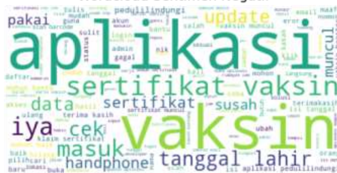
Gambar 5: Wordcloud Sentimen Negatif

Pada Gambar 5 diatas hasil wordcloud dari sentimen negatif menunjukkan bahwa terdapat beberapa kata kunci yang muncul dalam ulasan sentimen negatif terhadap aplikasi PeduliLindungi seperti “aplikasi”, “sertifikat”, “vaksin”, “tanggal lahir”, “susah”, “muncul”, dan “klaim”. Dari kata-kata tersebut menunjukkan bahwa pengguna aplikasi PeduliLindungi ini mengkritik mengenai sertifikat vaksin yang susah untuk keluar di dalam aplikasi PeduliLindungi ini serta susahnya menginput data tanggal lahir di dalam aplikasi ini.