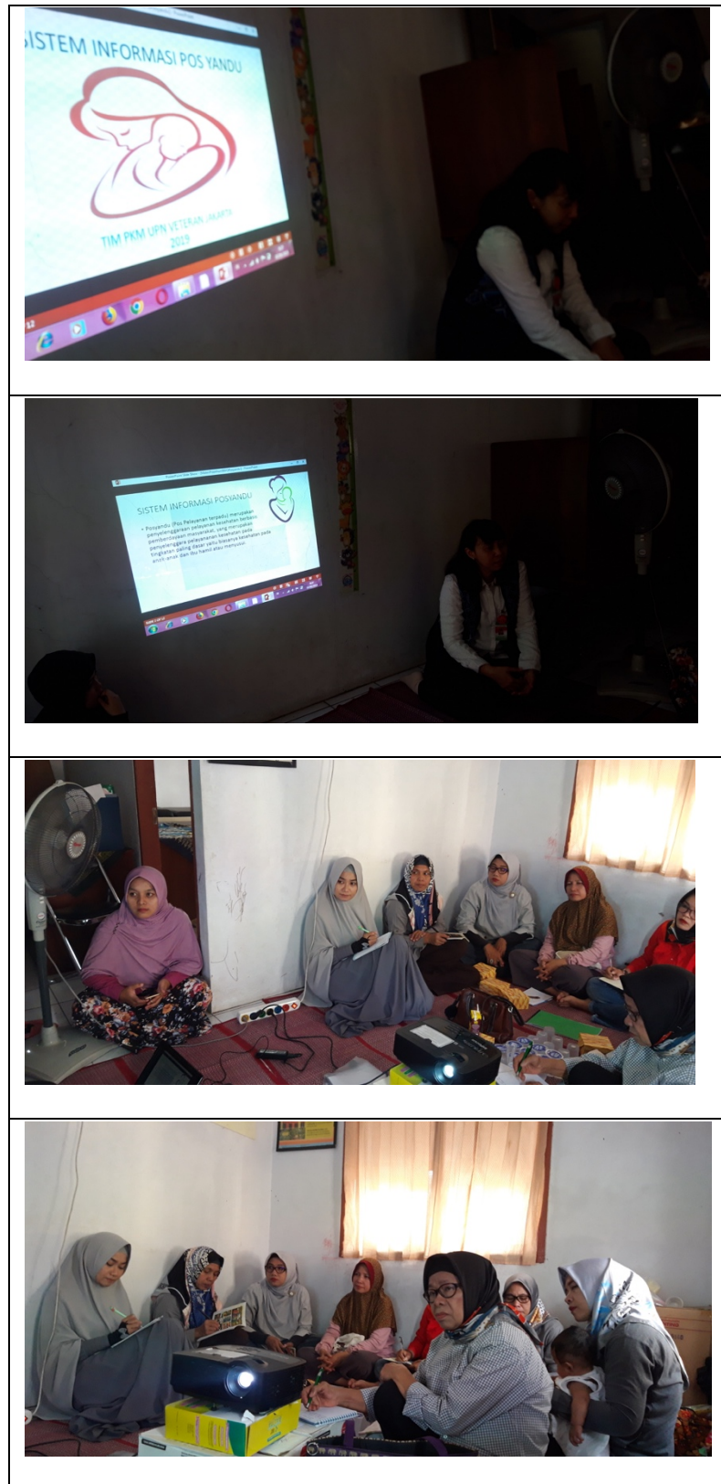
Gambar 7: Foto Kegiatan Pelaksanaan Sosialisasi Sistem Informasi Posyandu