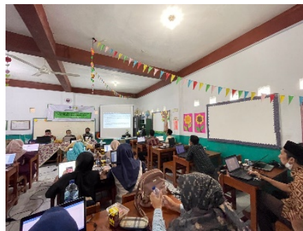
Gambar 1. Kegiatan Pelatihan

dari staff dan guru di sekolah. dilakukan sebanyak 3x pertemuan dengan pembagian 2x pertemuan tatap muka seperti halnya pada gambar 1. Pertemuan tatap muka ini dibagi menjadi 1x materi Microsoft word focus terhadap pembuatan setting up dokumen dan pembuatan daftar isi dan 1x pertemuan berikutnya yaitu materi Microsoft excel dengan focus materi kepada formula yang berperan dalam olah data akademik. Dua pertemuan ini masing-masing dilakukan 2 sesi yaitu sesi pagi dan sesi siang yaitu masing-masing sesi selama 4 jam.