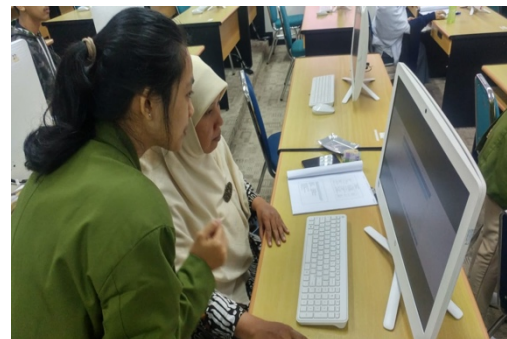
Gambar 1: Foto Dokumentasi Pelaksanaan Kegiatan PPM