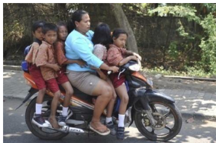
Gambar 1 Contoh ibu Yang Melanggar Peraturan Lalu Lintas

Kelurahan Ciganjur merupakan salah satu kelurahan dengan aktifitas berkendara ibu-ibu yang tergolong tinggi. Para ibu menggunakan kendaraan dalam melakukan aktifitas kesehariannya baik dalam mencari nafkah maupun untuk melancarkan aktifitas anak-anak menempuh tempat-tempat pendidikan baik formal maupun informal. Dalam berkendara para ibu di Kelurahan Ciganjur masih banyak yang tidak memperhatikan keamanan berkendara ( savety drive ) dan cenderung melakukan pelanggaran-pelanggaran terhadap undang-undang Nomor 22 Tahun 2009 tentang lalu lintas dan Angkutan Jalan yang dapat berakibat membahayakan bagi keselamatan para ibu sebagai sekolah pertama sang anak dan bagi anak-anak sebagai generasi muda penerus tongkat estafet bangsa. Peran ibu sangat penting dalam keluarga misalnya saat mengantar anak pergi kesekolah menggunakan alat transportasi salah satunya sepeda motor, dalam berkendara sepeda motor ada aturan-aturan yang harus ditaati guna terciptanya suatu keamanan dalam berkendara. Akan tetapi ibu-ibu kurang memahami dan menaati peraturan lalu lintas yang membahayakan bukan hanya dirinya tetapi juga orang lain terutama anaknya yang dibawa.