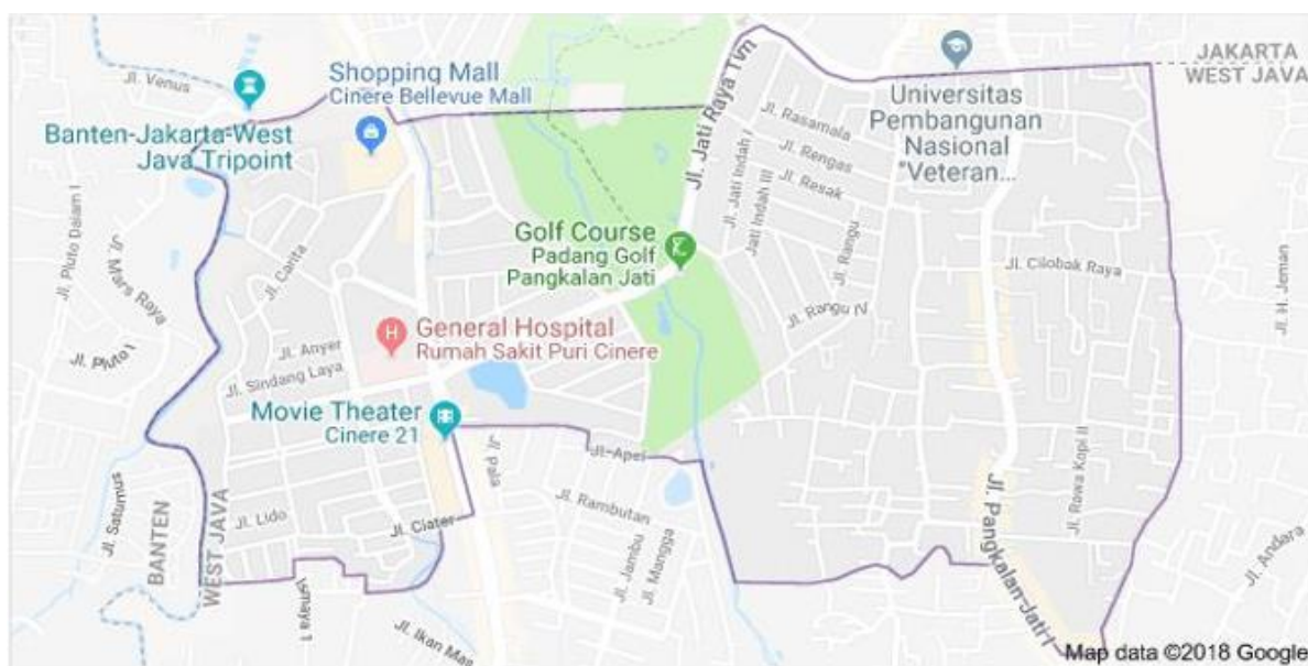
Gambar 1. Peta Kelurahan Pangkalan Jati

Adapun jumlah penduduk dan pendidikan di kelurahan Pangkalan Jati, kecamatan Cinere yang terdiri penduduk laki-laki sebanyak 17.320 jiwa dan perempuan sebanyak17.470 orang dengan tingkat pendidikan: Tidaknya/belum sekolah sebanyak 6.783, tidak tamat SD 4.480, tamat SD/ sederajat sebanyak 5.191, SLTP sebanyak 16.4690, SLTA/sederajat sebanyak 10.971, D1-D2 sebanyak 540, D3 sebanyak 562, S1 sebanyak 1921, S2 sebanyak 974 orang dan S3 sebanyak 927orang.