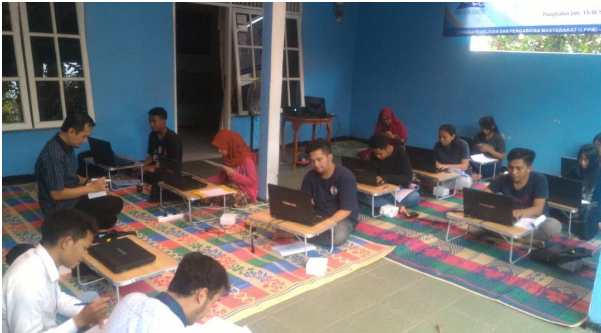
Gambar 3. Sesi Pre-Test