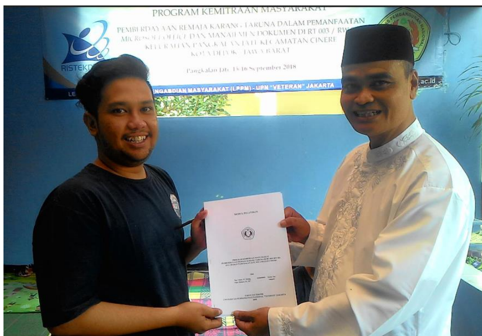
Gambar 4. Perwakilan Peserta dan Lurah Pangkalan Jati