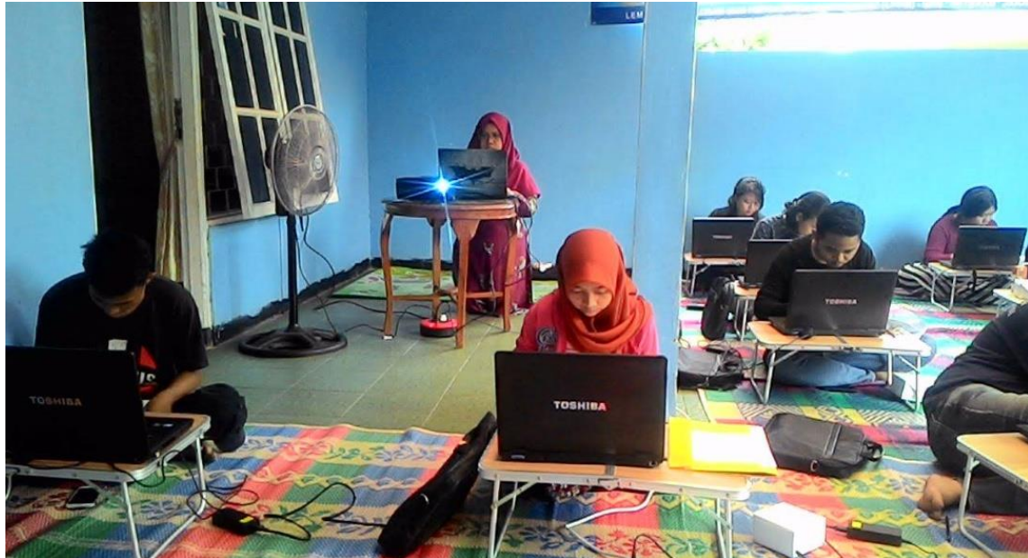
Gambar 5. Narasumber memberikan materi